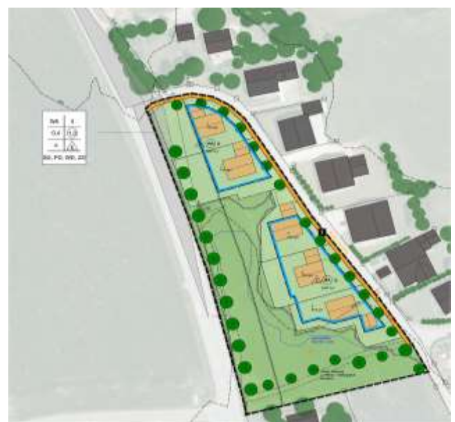
Gepplant sind fünf Bauparzellen für Einfamilienhäuser mit Grundstücksgrößen zwischen 530 und 870 m 2 . Planentwurf: AR.LAND