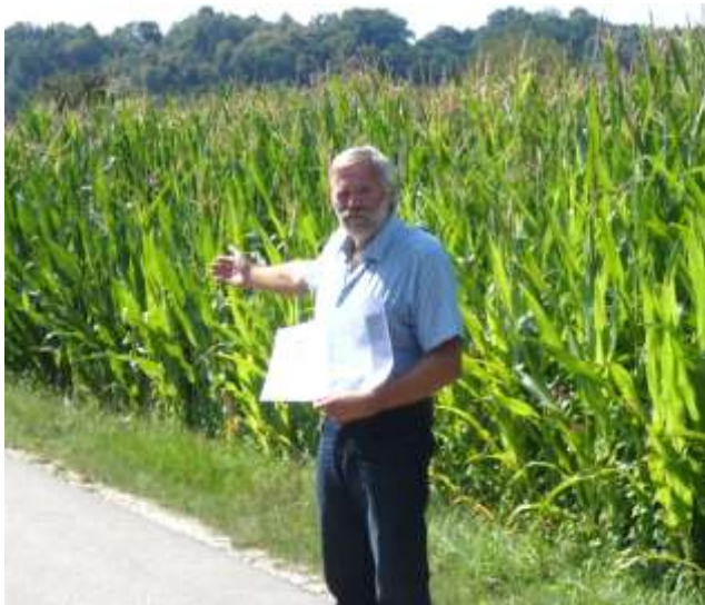
Am Rottauenweg soll das neue Baugebiet „Stegmühle“ entstehen.

In der Gemeinderatssitzung am 10.07.2018 wurden die Weichen für neue Bauplätze in Postmünster gestellt. Nachdem der Verkauf der Bauparzellen im Baugebiet Waldhöhe sehr zufriedenstellend verlaufen ist und die Nachfrage nach Baugrundstücken nach wie vor ungebrochen ist, war die Gemeinde auf der Suche, nach weiteren Entwicklungsmöglichkeiten.