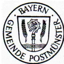
Stefan Weindl 1. Bürgermeister