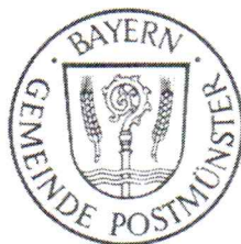
Stefan Weindl 1. Bürgermeister