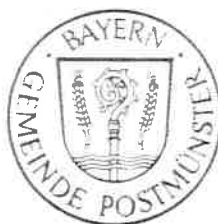
Stefan Weindl 1. Bürgermeister